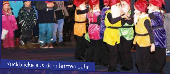
Rückblicke aus dem letzten Jahr