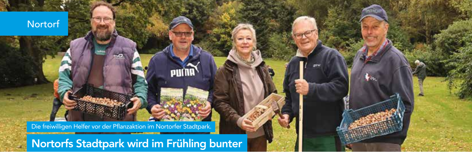
Die freiwilligen Helfer vor der Pflanzaktion im Nortorfer Stadtpark.