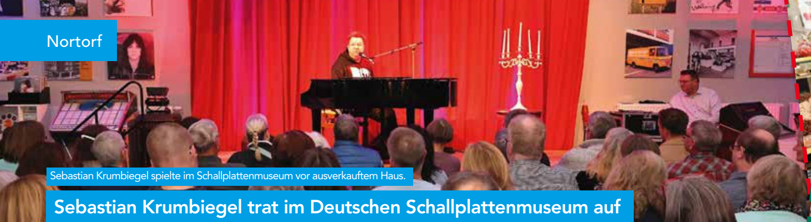
Sebastian Krumbiegel spielte im Schallplattenmuseum vor ausverkauftem Haus.